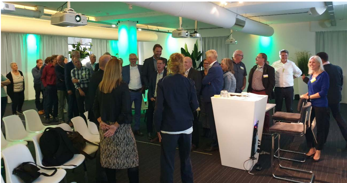
Colland Bijeenkomst 24 september (MeetInOffice, Woerden)